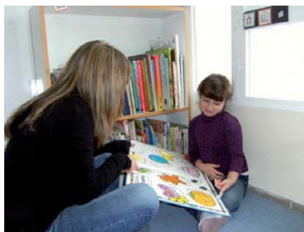
Una forma lúdica de aprender.