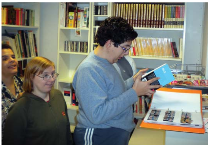
Los libros permiten trabajar la inteligencia emocional.