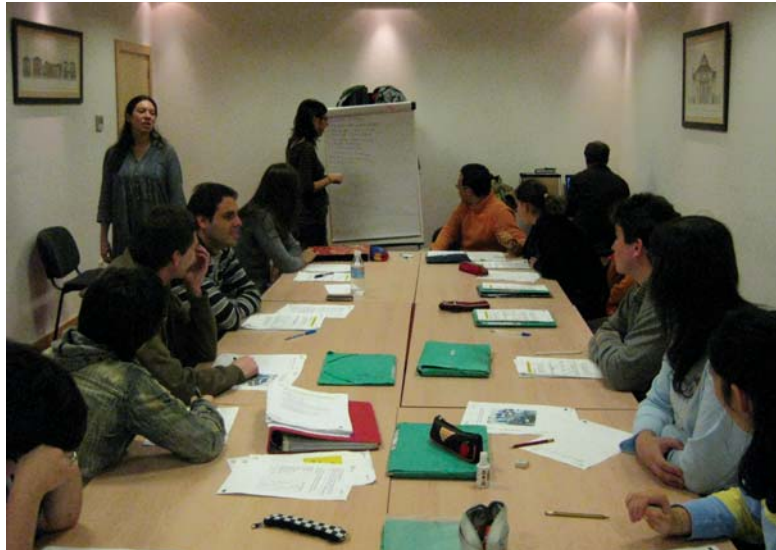
En clase.

La Fundación Aprocor, con la colaboración del programa INSERTA de la ONCE, ha puesto en marcha una nueva edición del Curso de Auxiliar Administrativo destinado a personas con discapacidad intelectual.