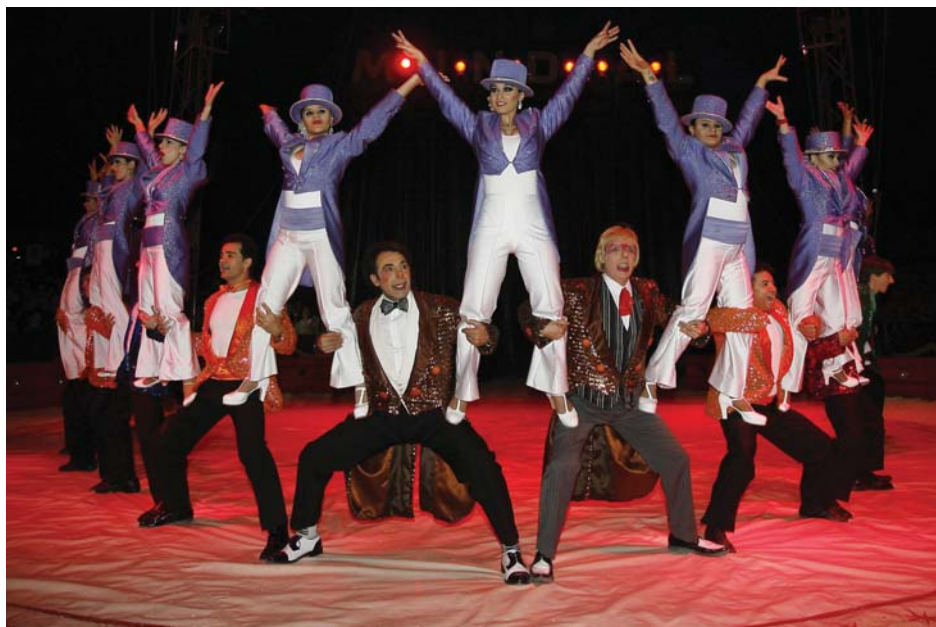
Actuación final Circo Mundial.

Muchos clientes y colaboradores de Gmp asistieron con sus hijos a esta sesión de circo y han transmitido su enhorabuena a la empresa por el alcance y valor solidario de esta acción.